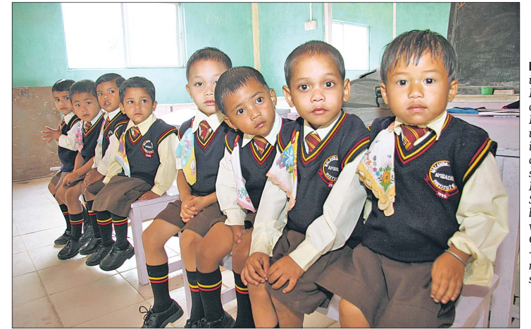
Ein festes Dach über den kleinen Köpfen dank der Fairtrade-Prämien. Schuluniformen sind in Indien Standard. Ebenso spontan wie der Besuch in dieser Schule für Vier- bis Achtjährige waren auch die Gesangseinlagen – samt Nationalhymne versteht sich!