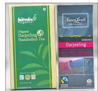
Zwei Verpackungen, gleicher Inhalt: Das Fairtrade-Siegel (Produkt rechts) macht den Unterschied zwischen fairem oder unfairem Handel.