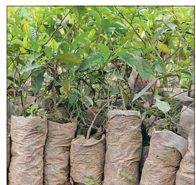
Zeitaufwendig: Nach einem Jahr werden die Setzlinge in die Hügel gepflanzt. Etwa im fünften Jahr danach sind die Tee-Büsche bereit zur Ernte.