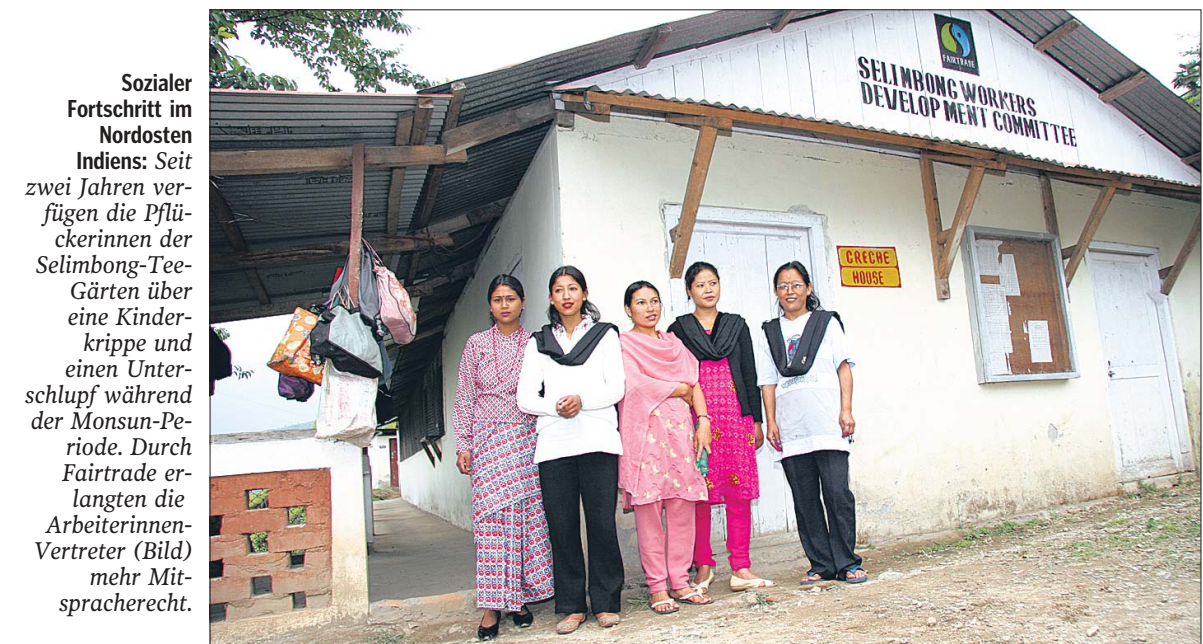
Sozialer Fortschritt im Nordosten Indiens: Seit zwei Jahren verfügen die Pflückerinnen der Selimbong-Tee-Gärten über eine Kinderkrippe und einen Unterschlupf während der Monsun-Periode. Durch Fairtrade erlangten die Arbeiterinnen-Verehrer (Bild) mehr Mitspracherecht.