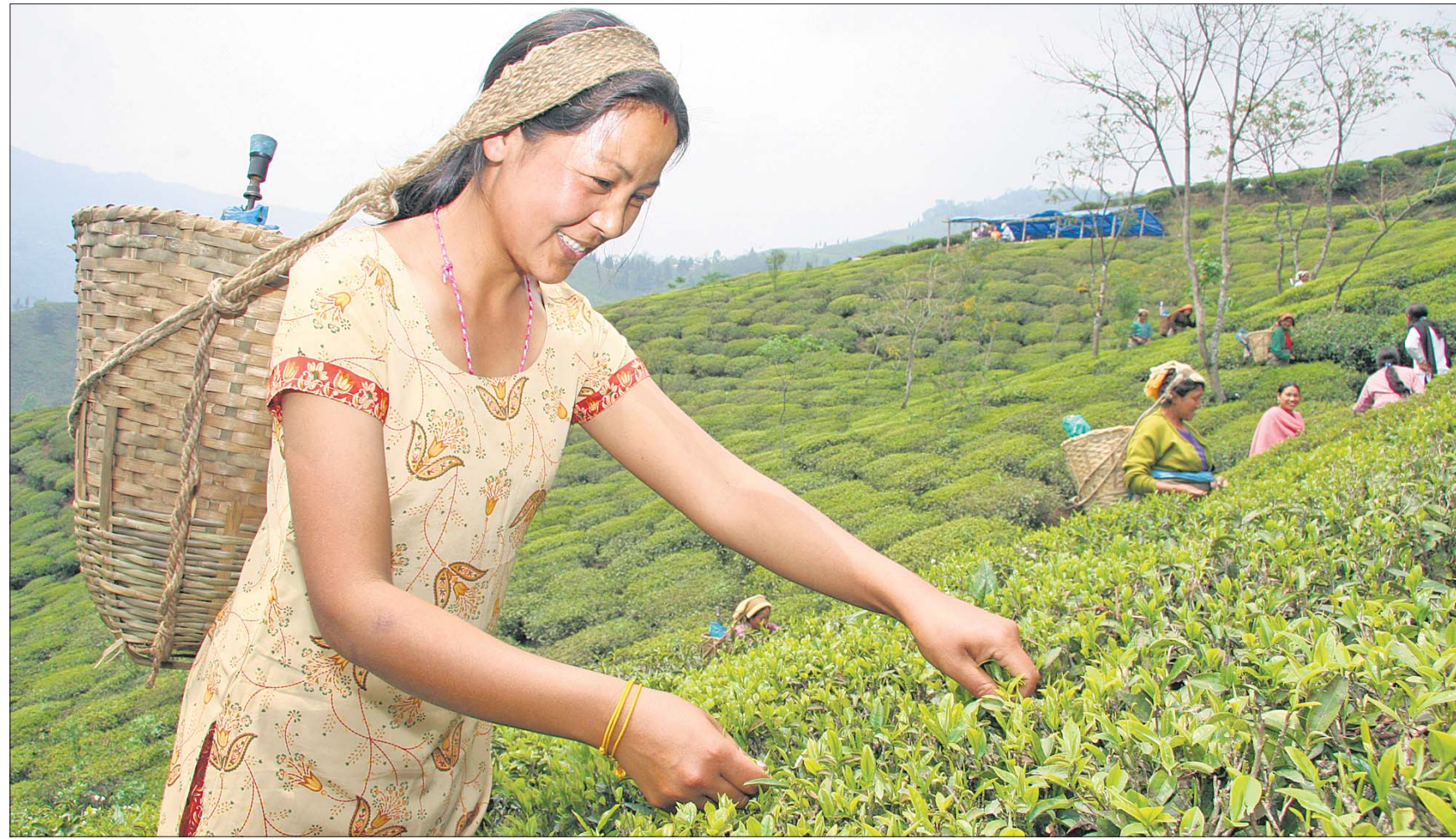
TransFair-Minka unterwegs im Nordosten Indiens auf den Spuren des grünen und schwarzen Tees