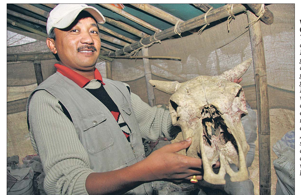
Verzicht auf Chemie: Auf den Tee-Plantagen der Selimbong-Kooperative greift man u.a. auf eine bio-organische Düngung zurück. Erde und Laub wird etwa in den Schädel eines toten Tieres gestopft und einige Monate „ziehen“ gelassen. Als Endprodukt kommt qualitativ hochwertiger Dünger heraus.