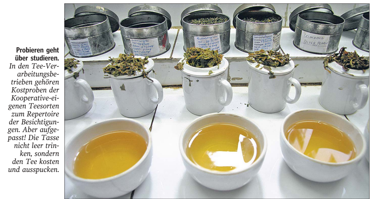
Probieren geht über Studieren. In den Tee-Verarbeitungsbetrieben gehören Kostproben der Kooperative-eigenen Teesorten zum Repertoire der Besichtigungen. Aber aufgepasst! Die Tasse nicht leer trinken, sondern den Tee kosten und ausspucken.