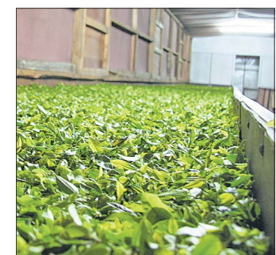
Welken im Eiltempo: In bis zu 16 Stunden wird den Blättern 70 Prozent Feuchtigkeit entzogen. Beim grünen Tee wird auf das Welken verzichtet.