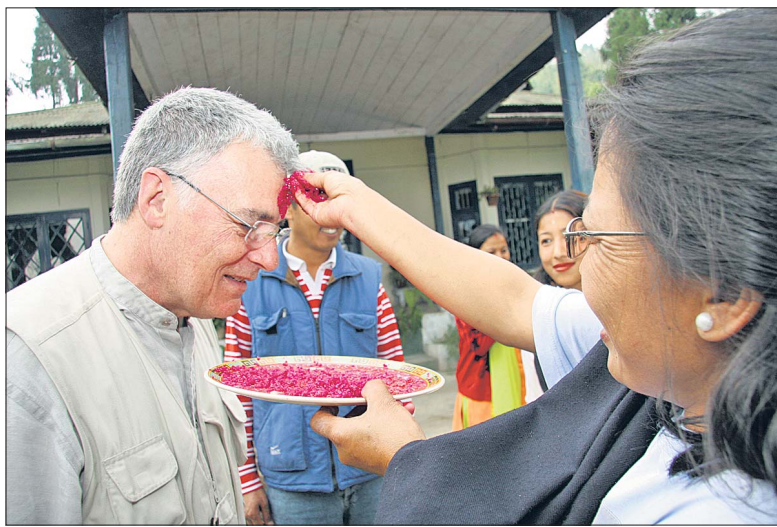
Tradition zur Begrüßung: natürlich gefärbter Reis auf die Stirn des Gastes.