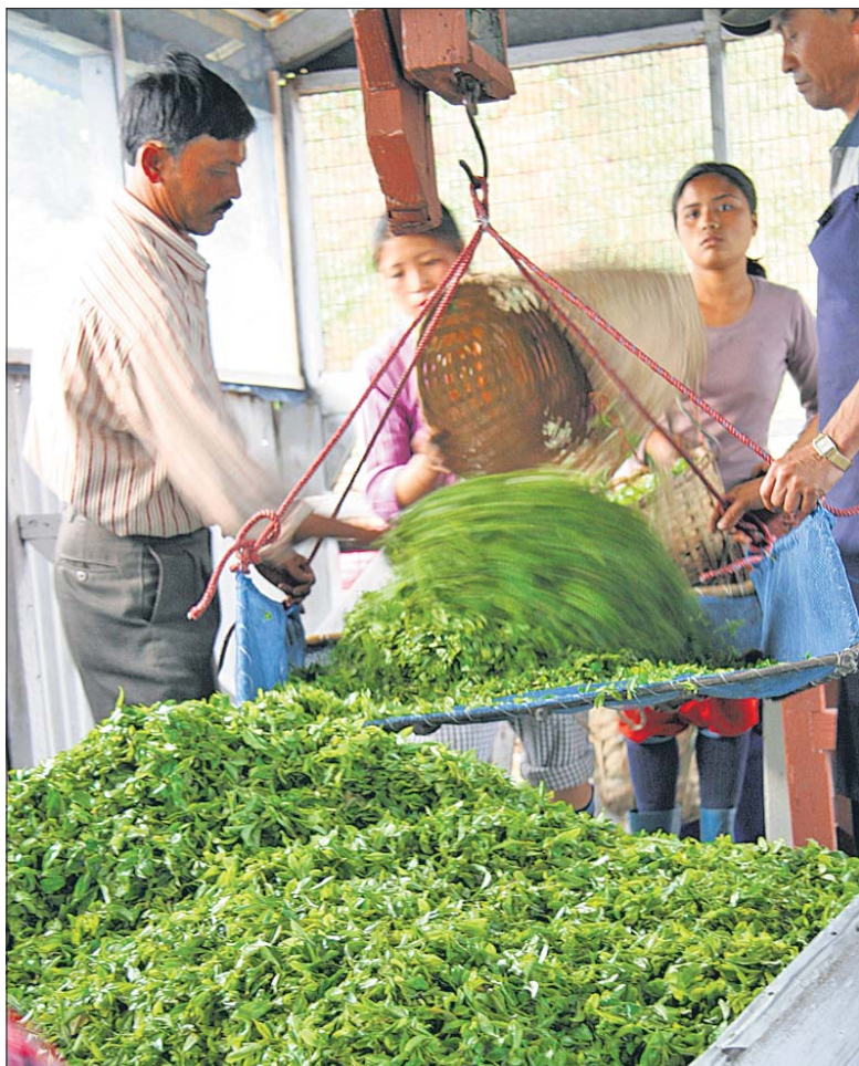
Sorgsam abgewogen und zur schrittweisen Tee-Verarbeitung freigegeben.